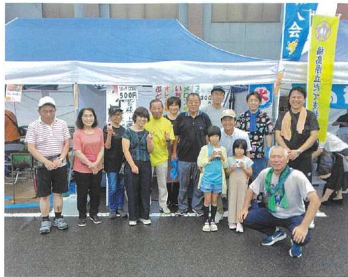
サマーフェスティバルへ参加 (令和7年8月11日)

大田の地名や方部等はまだまだ勉強不足なので、大田を故郷と呼ぶのはおこがましいですが、私のことも達にとつては、紛れもなく大田が故郷となります。