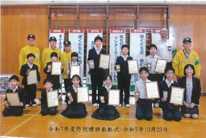
令和7年度防犯標語表彰式、令和7年10月23日

玄孫が4人になりました。毎週デイサービスに行く事が楽しみです。家族に日々感謝をしながら、これからもよく寝て、しっかり食べて健康に過ごして行こうと思います。