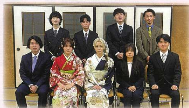
金原田 二井田 大立目地区