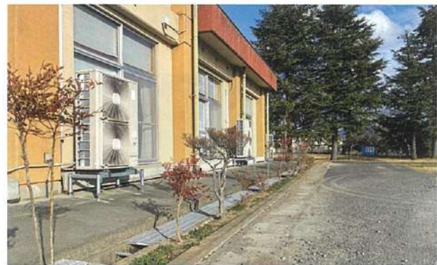
南天を植え付けた交流館和室側