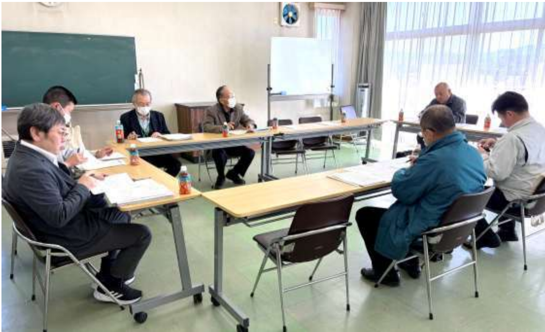
3月17日に伊達東地区交流館で開かれた令和7年度第2回会議

去る3月17日、伊達川東悪臭改善連絡会の7年度第2回定例会が伊達市・県・（株）しまぎ牧場等が出席し、伊達東地区交流館で開催されました。