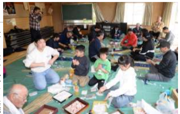
子どもも大人もいっしょに花づくり(4月12日・改善センター)