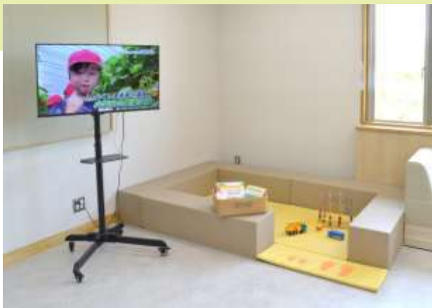
キッズスペースとデジタルサイネージ