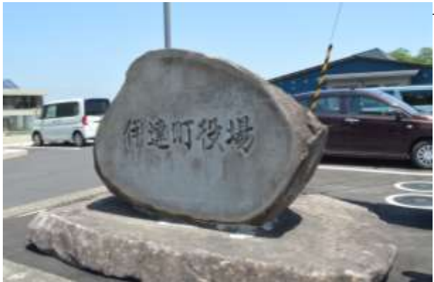
旧伊達町役場の石碑が記念として残る。