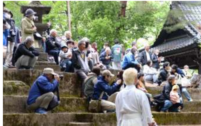
神社へは表参道である石段で登ります。今年は前日の雨で濡れていて大変でした。(4月29日)