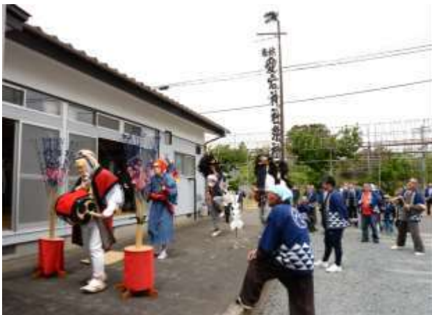
4月30日は村廻りで各集会所などで舞う。写真は上川原集会所。

4月29日・30日、箱崎愛宕神社例大祭で獅子舞の奉納・村廻りが行われ、多くの観覧者のみなさんが、県重要無形民俗文化財の伝統の舞を楽しみました。なお29日には、福島中央テレビの生中継「ゴジてれChu!」の中で例大祭が紹介されました。