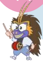
〈はこふし〉PRキャラ 仮称：ししたん