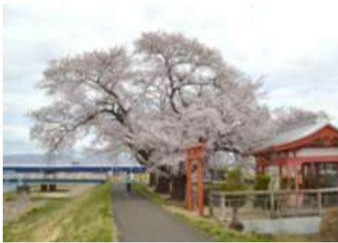
金子公園の桜は毎年目を楽しませてくれる。