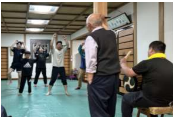
大先輩たちが見守る中、獅子舞の練習開始(4月20日・福厳寺)