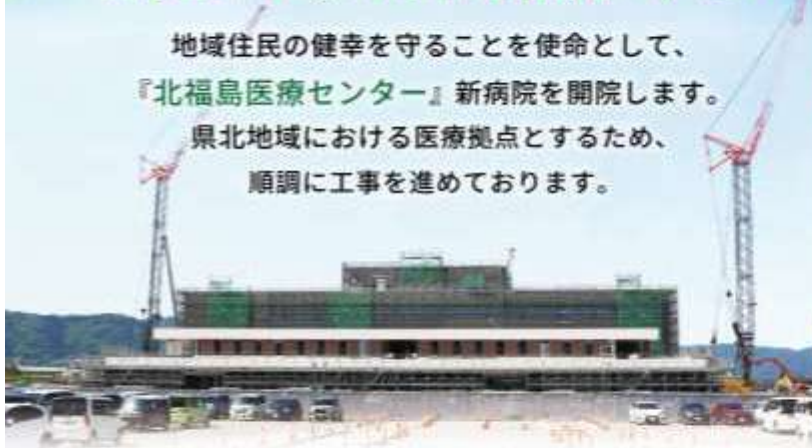
南側外来棟の足場が外れました。(2026年5月撮影)

地域住民の健幸を守ることを使命として、 『北福島医療センター』新病院を開院します。 県北地域における医療拠点とするため、 順調に工事を進めております。