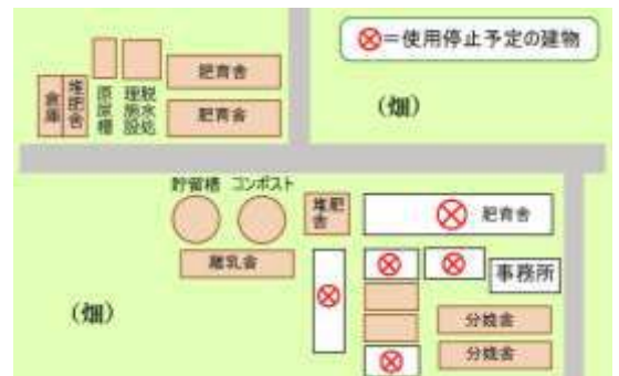
使用を停止予定の施設（しまぎ牧場）

伊達川東地区協議会、（株）しまぎ牧場、伊達市（生活環境課・農政課）、福島県（県北方振興局・県北農林事務所伊達農業普及所・県北家畜保健衛生所）、桑折町