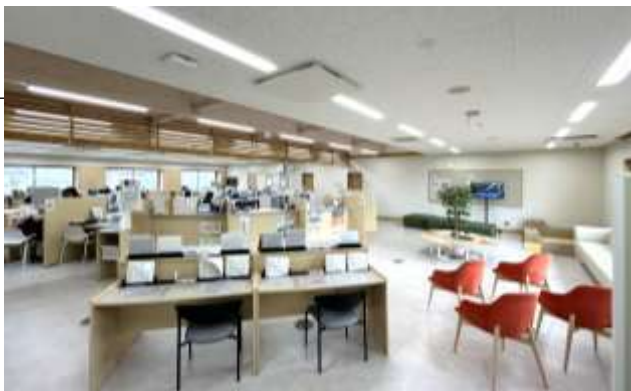
南向きで明るい窓口のロビー