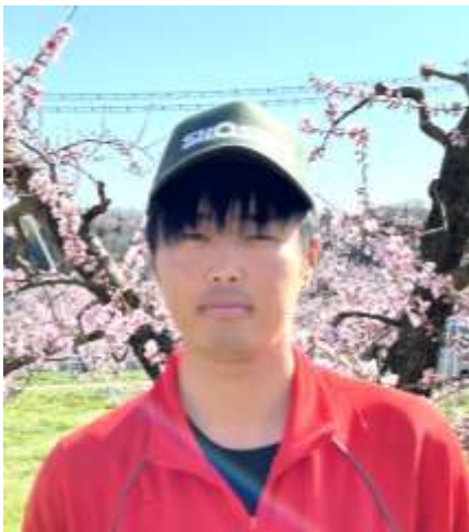
取材にお伺いしたときは桃の花が満開の下、指導にあたる農家の皆さんと一緒に剪定枝の処理作業にはげんでいました。