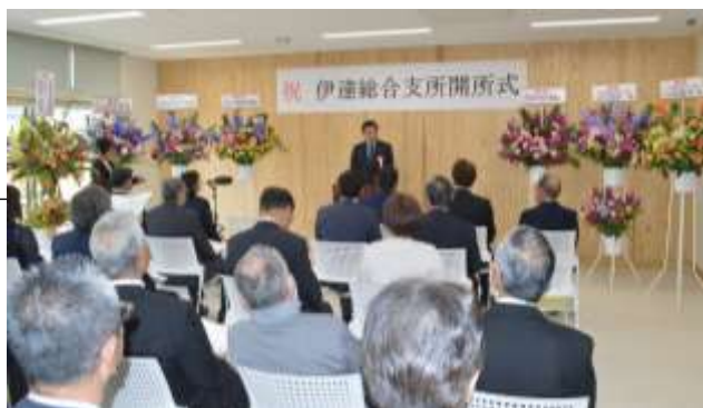
多目的室で開所式

なお、支所機能が仮移転していた福祉センターの2階大会議室は、4月から一般利用が可能になりました。