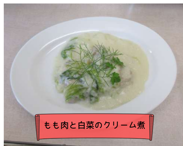
もも肉と白菜のクリーム煮