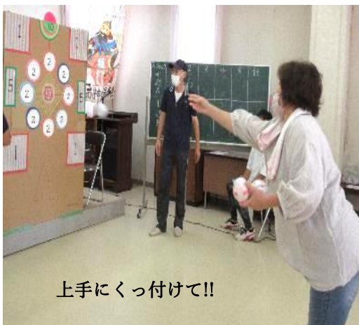
上手にくっ付けて!!