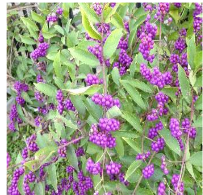
色鮮やかな 紫式部

～～編集後記～～ 猛暑の影響で野菜が生育不良となり、価格が高騰しているというニュースが連日テレビなどで報じられています。ここ数年の異常気象は、色々な事に影響を与えているようですね。