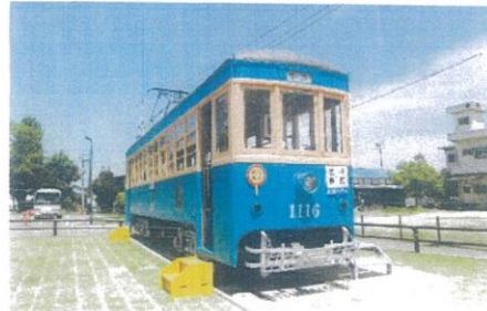
保原交流館 修復保存展示路面電車1116号 2015年5月5日撮影