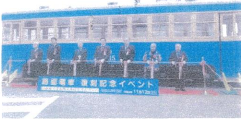
福島交通掛田駅舎 1115 車両