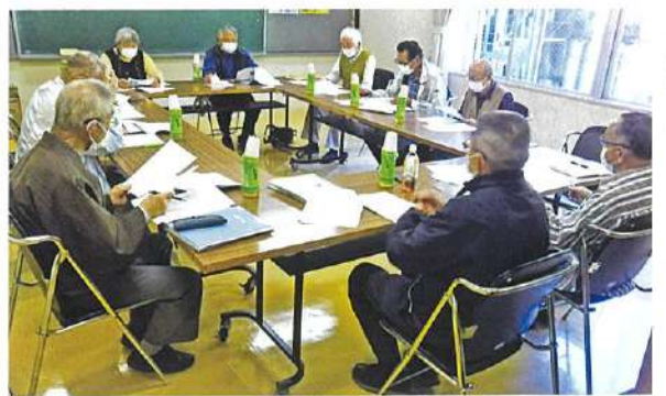
令和4年第1回役員会

令和4年の代議員53名中50名の皆さんから「承認」を頂き新年度事業のスタートを切りました。