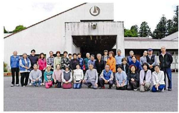
令和4年6月5日(日) 第1回ラジオ体操会

6月から7月の日曜日、第7回ラジオ体操会を開催致します。8月、映画祭、10月初秋の自然探勝会、12月ミニ門松作り。どのイベントも皆さんが気軽に取組めますので多くの方々の参加をお待ちしております。