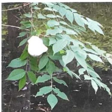
徳が森で見つけたモリアオガエルの卵