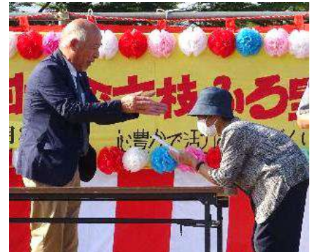
特賞おめでとうございます