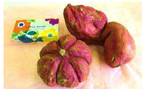
大きなサツマイモが穫れました

火曜・木曜日 午前10:00～11:30 交流館 (和室) どなたでも参加OKです。