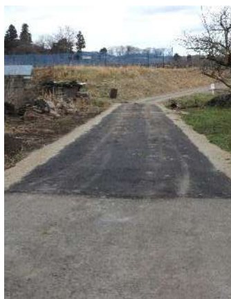
本館・井戸淵線 完了しました。