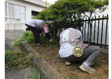
交流館除草ボランティア 9/2