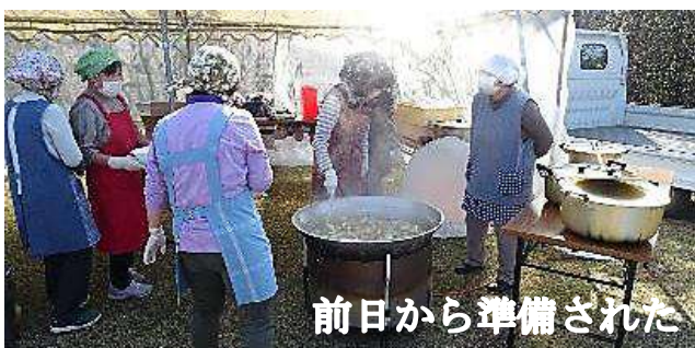
前日から準備された