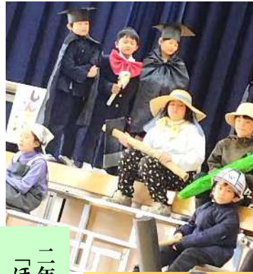
二年生 劇 「ほんとうの宝もの」