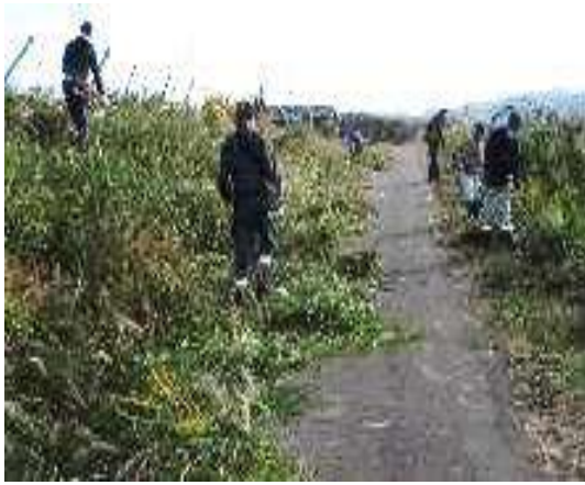
10月29日(日) 東大枝地区内一斉除草作業が行われました。(保全会) 写真は、上通り町内会の作業の様子です。