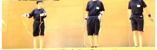
五年生 運動・表現 「スクラムトライ」