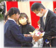
親御さんへ感謝の思いを込めて花束贈呈