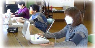
開始前は健康チェックからスタート！

* 足を鍛えるスクワットは、膝や腰を傷めない様に足のつま先より前に膝を出さない意識。又、朝布団から起き上がる時の負担のない体勢の順序等々。「参加して納得！」とのお声が多数～。