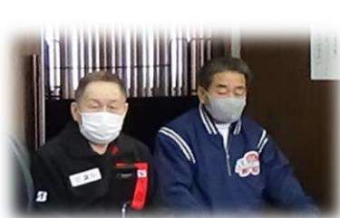
三品自治会長と宗川体育協会会長も参加。健康運動指導士の的確なアドバイスを受けながら、ロードバイク！

足のむくみもエアーマッサージですっきり楽になり、同時に全身もほぐれて、つい、ウトウト～。