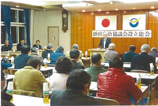
掛田自治協議会設立総会 (平成28年3月1日)

(※) 設立総会で提示された議案書は3月10日に各地区で回覧されています。何か質問などがありましたら協議会までご連絡ください。