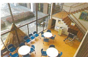
霊山中央交流館 ロビー