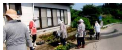
右代なかよしサロンの植栽風景

6月19日右代集会所に花苗の植え付けをしました、朝から汗が流れる暑い日でしたが、11人もの参加者の手できれいな花壇になりました、これから水やり、除草など手入れをしますので、通りがかりに目を止めて見ていってください。