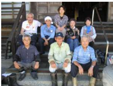
霊山寺でのメンバー

7月31日(日曜日)大石楽生会会員の皆様と霊山寺婦人会の皆様による、菩提寺の奉仕作業が行われました。湿度が高く、35度以上の気温の中、奉仕作業をして頂きました。本堂の周りが綺麗になりお盆を迎えることが出来ました。暑い中の奉仕作業、本当にありがとうございました。