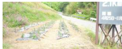
広畑・楮畑 婦人フラワーロード