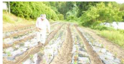
広畑・楮畑 婦人フラワーロード