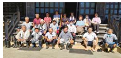
大善寺でのメンバー