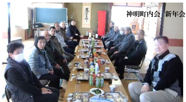
神明町内会 新年会

新型コロナウイルス感染症の5類移行に伴い、今年は全部の町内会で、4年ぶりに新年会(顔合わせ会)が行われました。