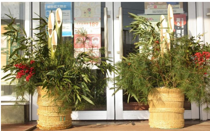
自治会役員による手作りの 門松 (12/28)

新型コロナウイルス感染症の5類移行に伴い、今年は全部の町内会で、4年ぶりに新年会(顔合わせ会)が行われました。