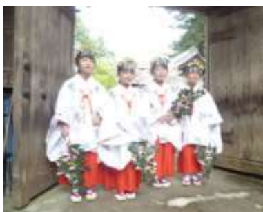
新しい巫女さん4名