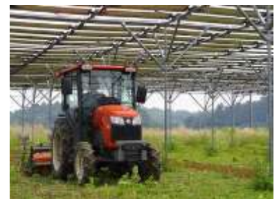
営農型太陽光発電 (農水省HPより)