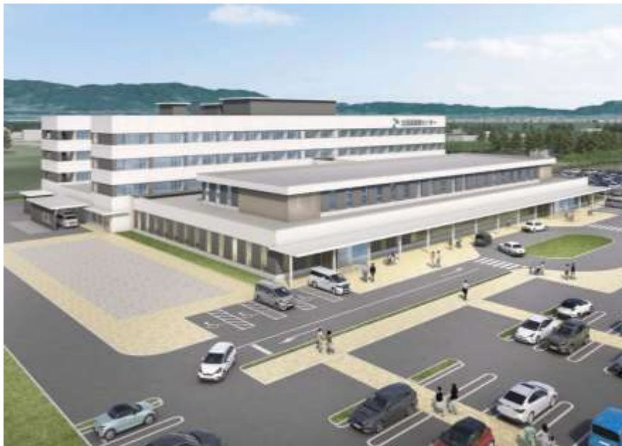
新・北福島医療センター完成予想図

北福島医療センターの新築移転計画がこのほど公表されました。現在の隣地に外来棟と入院棟が新設されるほか、診療科目の増設など機能の強化も行われる予定です。