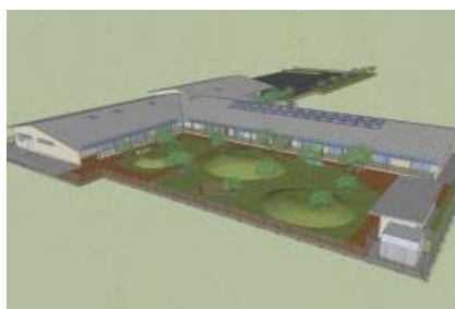
ひかり認定こども園は、学校法人神愛学園 が建設・運営します

東グラウンド東側に来年4月 に開園する「伊達・ひかり認定 こども園」の建設が急ピッチで 進んでいます。 認定こども園は、民間の学校 法人が、市の補助を受け、伊達