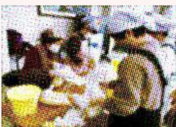
桑折町のキッコーゲン醤油さんを 講師に、26名が参加しました。