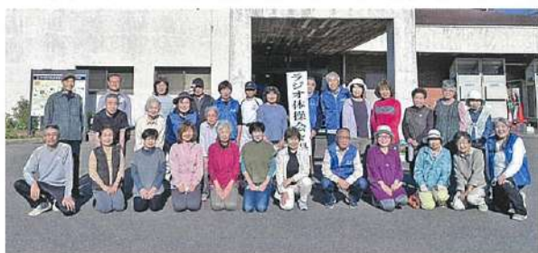
今年も元気に始まりました(第1回)

7月30日まで の毎週日曜日の 朝6時30分から 中央交流館玄関 前にて開催致し ます。夏空の爽や かな朝の時間を 掛田地区皆さん と過ごしたいと 思っております。 (5回以上参加の 方には、参加賞 を差し上げます)