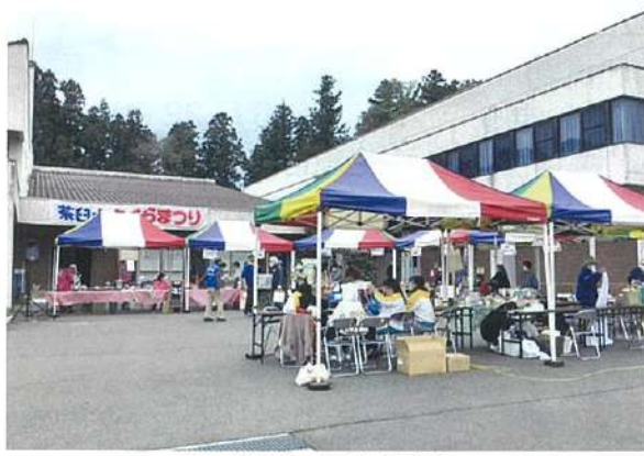
にぎわった中央会場

コロナ対策(ワクチン接種・消毒・ 換気・行動の自粛・マスク生活など など)により、今年に入り感染の減 少傾向が進み「茶白山さくらまつり」 が話題になり、自治協議会が各団体 に呼びかけ、お話を聞きし「さく らまつり実行委員会」を立ち上げる 事から始まりました。数年ぶりのな で以前を思い起こし何度もの議論 を繰り返して、まとめた企画でした。 急遽集まった実行委員会のメンバ ーの皆さんもお疲れの寒い夜の会議本 当に有難うございました。先ずは先 立つ予算・財務面でも大変でしたが、