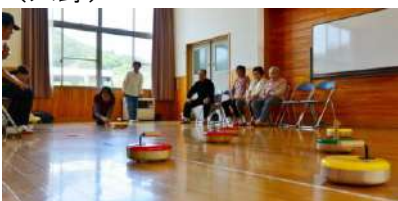
フロアーカーリングの風景

5月28日、第2回チャレンジデーが行われ、地区交流館ではフロアーカーリングや卓球で大石の皆さんが参加しました。広島県三次市との対戦では、伊達市は、0.5%の差で負けましたが、健康づくりには、有意義な運動になりました。(只野)