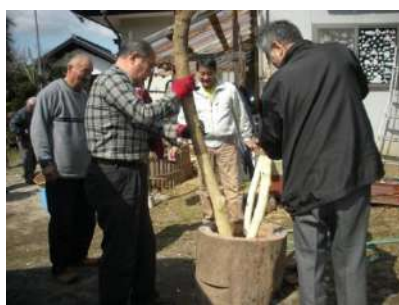
杵と臼で米粉をつく男性たち

4月6日、靈山寺檀信徒が参集し、お釈迦様入滅日の法要である「涅槃会」で、『だんごまき』を行いました。男性は屋外で約20臼分の米粉をつき、女性がだんごにし茹でる作業をしました。だんごは祭壇に奉り、清海大僧正により祈願が行われ、総代によりだんごが撒かれました。（精）