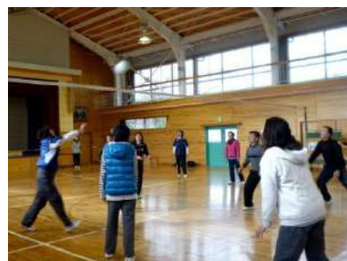
3方部対抗で熱戦が繰り広げられ、下大石チームが優勝しました(初)