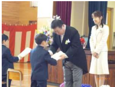
教科書を授与される新入生

4月7日、大石小学校の入学式がありました。緊張した姿で式に臨む新入生たちでしたが、在校生や教師、保護者、地域の人々に見守られ、生涯忘れることのない入学式となったことでした。子供たちに末永く幸多かれと祈ります。（庄）