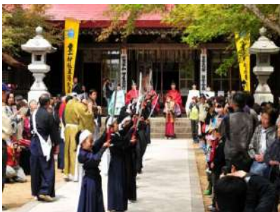
濫觴の舞を奉納する小学生たち

また、下大石、泉原、中川地区の太鼓保存会による勇壮なバチさばきの「靈山太鼓」、「巫女の舞」や「日本舞踊」、「棒術」、「居合道」なども奉納され、訪れた観客を楽しませました。（ト）