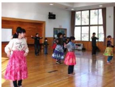
初めてのフラダンス体験

コサージュ作りは、一年生の児童にとってはまだ難しかったようですが、なかなかの出来映えに仕上がっていました。また、フラダンスを体験した親子は、手足の動きに戸惑いながらも、楽しく体を動かしました。(由美子)