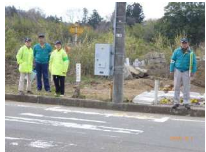
鳥居広道交差点でのドライバー向けの街頭指導（ト）