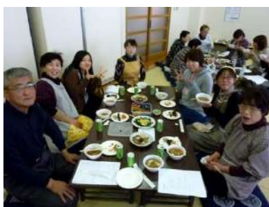
大学生と交流しながら舌鼓

また、地域活性について研究する福島大生が大石地区内を見学し、昼は講座の参加者と一緒におせち料理を食べ、老若男女入り混じりながら楽しく親睦を深めました。(ケイ子)