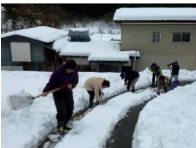
住民総出で生活道路の雪かき

17日の朝、南方部会館に伊達市職員や消防団幹部等が集まり、孤立家族の有無や状況把握にあたりました。午後には南方部と北方部の女性部有志による炊き出しが行われ、一人暮らしの高齢者50人へ食事を届けました。夕方には除雪が行われ、車も走れるようになり、電気も開通しました。(初)