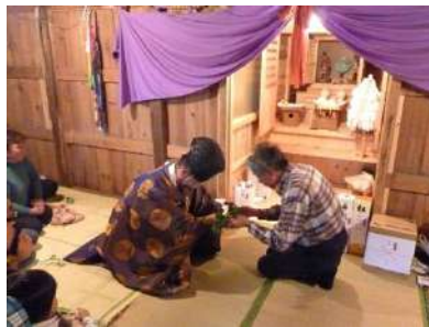
愛宕様の祭礼で足立宮司から玉串を授かる氏子