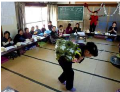
30名以上が参加し、ゲームや歌で盛り上がったクリスマス会

手作り料理や手芸の時間を設け、和気あいあい楽しんでいます。住民の皆さんがなるべく参加できるように工夫し、交流の輪を広げていきたいと思っています。