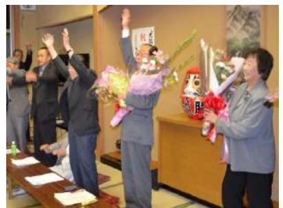
三期目の当選を果たして喜びの万歳三唱（初）