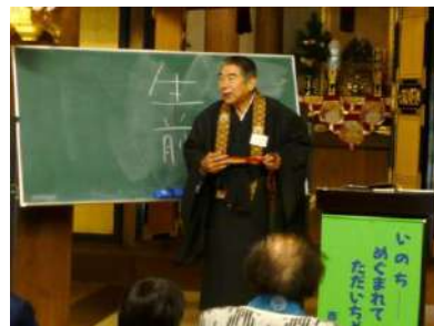
全員で勤行を行なった後、布教使の法話を聴聞しました(初)