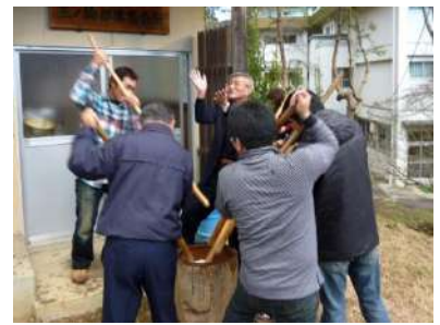
昔ながらの千本杵で行う餅つき（三ノ輪）

現在では、北方部や下大石の一部の集落で受け継がれており、年末の風物詩となっている。