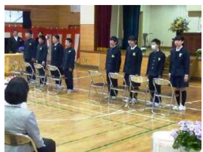
大石小の思い出を胸に抱き

2月に三十数年ぶりの大雪に見舞われたとき、6年生が後輩たちを率いて登下校した姿は立派でした。大石で育った誇りを持って、今後の活躍を期待しています。(庄)