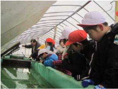
鮭の孵化場 (右代) で学習

子どもたちと一緒に鮭を育て放流する活動を通して、命の大切さや自然環境について学んでいます。原発事故に負けず、今後も積極的に活動を続けていきたいと思えます。