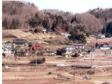
出広中心部の家並み。日当たりが良く、雪解けが早い

例年の初午に稲荷神社祭礼を倉波と合同で実施 (旧 2 月)、花見 (4 月)、芋煮会 (10 月)