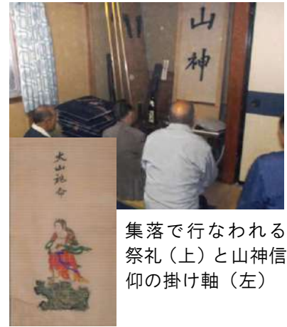
集落で行なわれる 祭礼(上)と山神信 仰の掛け軸(左)

以前は宿持ち回りの泊まり 込みで実施していたが、現在で は1日のみで行なわれており、 小坂、右代、坊ノ内、田代など 南方部の集落や北方部の一部 で続けられている。