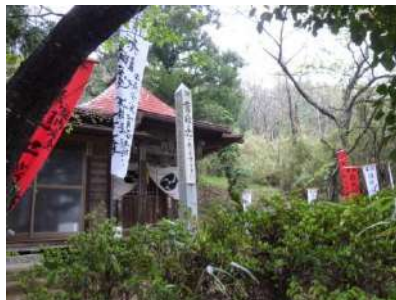
千手観音堂の祭礼