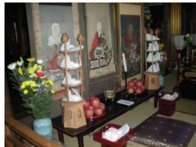
本堂に飾られた天台大師、伝教大師、慈覚大師の掛け軸(精)