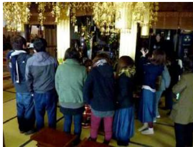
霊山寺本堂を見学する福大生

午前は、2つのグループに分かれ、霊山寺と大善寺で講話を聞いたり、本堂を見学したりして歴史や文化などを学びました。