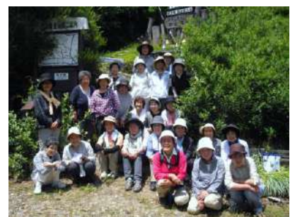
麓で全員でハイ、ポーズ

いつも忙しい生活をしている中、こうして青空の下でゆっくりと地域の人たちとふれあう時間を大切に、より絆を深めていきたいと感じた1日でした。これからも、会員相互の交流を図る楽しい時間を過ごせるような企画をして行きたいと思えました。(ト)