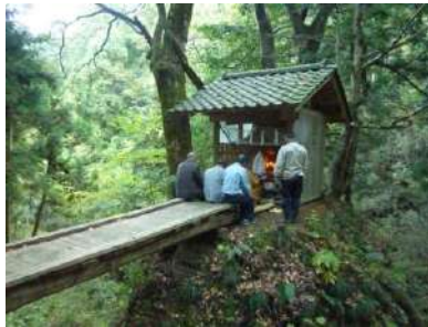
岩滝弁財天の祭礼