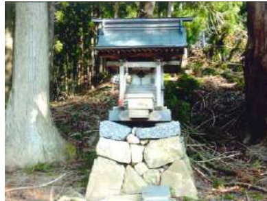
山懐に厳かに鎮座する文殊尊。秋の祭礼では北又獅子舞が奉納