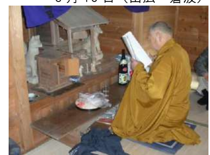
霊山寺住職による祈禱が行われ、集会所で直会を行いました(精)