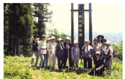
頂上を極めた人たち