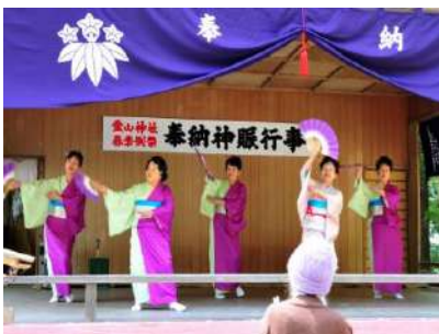
祭礼に花を添える日本舞踊