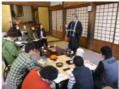
大善寺の住職の講話を拝聴

午後は、下大石・南方部・北方部に分かれ、それぞれの方部の方々から、地域の歴史や地名の由来、昔の子どもの頃の遊びなどの話を聞きました。また、ご持参いただいた集落の古い史料を閲覧し、貴重な学びの時間となりました。