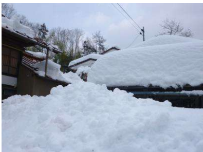
雪に埋もれた山間部の集落

2月14日から16日にかけて東日本の太平洋側地域は大雪に見舞われ、大石地区の山間部では先週の雪との累積で80cmの雪が積もりました。これは昭和55年12月24日以来の大雪で、水分を含んだ重い雪が竹や木を倒して電線が切れ、南方部では2日間停電となり、電気や電話、水道が使えなくなりました。