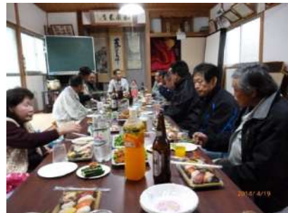
家族同伴で参加の方もいて、にぎやかな一夜を過ごしました（庄）