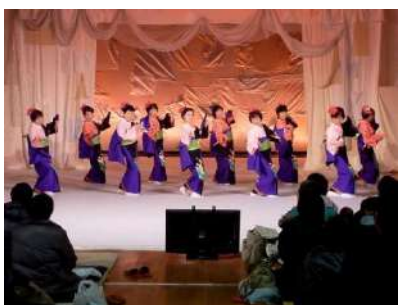
虹の会による艶やかな踊り