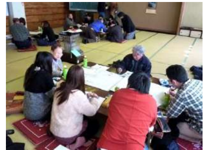
南方部会館での聞き取り調査

今回の調査では、福大生が大石地区の歴史等を学ぶとともに、住民の方々も若い学生たちから新鮮な刺激を受けていました。今後も地区住民と大学生交流を続け、地域再発見の事業を進めていきます。（裕二）