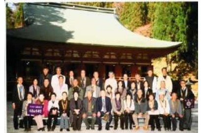
天台宗総本山の比叡山延暦寺に参拝しました（精）