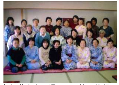
飯坂花ももの湯にて、皆、笑顔で温泉を楽しみました(由)