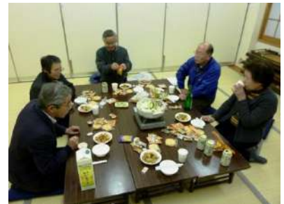
編集会議の後、ささやかな新年会を行いました（支）