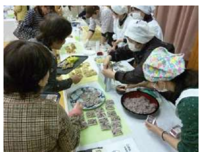
料理の説明をしながら和やかに

3月30日、霊山ふれあいセンターにて、大石地域活性化協議会主催の『大石食べもの博大交流会』が開催されました。大石で代々受け継がれてきたおふくろの味や郷土食をテーマに、自慢の29品目が並び、会場は地区内外から訪れた150名を超える来場者で賑わいました。