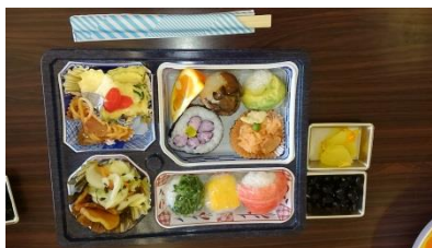
飾り寿司と手まり寿司

下大石ふれあいサロンでは、3月24日に今年度の反省と来年度の計画を話し合いました。参加者28名でまず最初に飾り寿司と手まり寿司をつくりきれいに、美味しくできたことを喜び合いました。1年間休まず参加の会員も多く、サロンは、楽しい交流の場であり来年度も皆で楽しむため会員募集をします。4月7日まで各部落のサロン連絡員にお申し込み下さい。