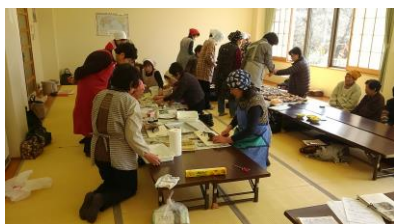
全員で盛り付けました。