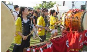
北方部太鼓保存会

第33回「霊山太鼓まつり」が 原運動公園で開催され、大勢 の観客で賑わいました。力強い 太鼓、勇壮なバチさばきで、大 石各方部の霊山太鼓が夏の空に 響きわたりました。