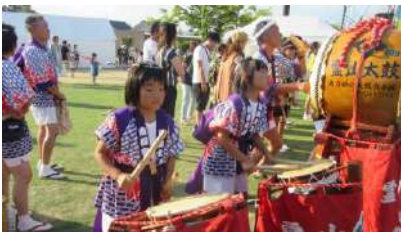
南方部太鼓保存会