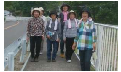
ウォーキングの様子

今回の下大石のサロンは、チャレンジデーにみんなで参加しようということで、お茶会をしてからフロアーカーリングを行い、その後全員で霊山神社下広場までウォーキングをしてきました。曇り空でさわやかな風が心地よい運動日和でした。