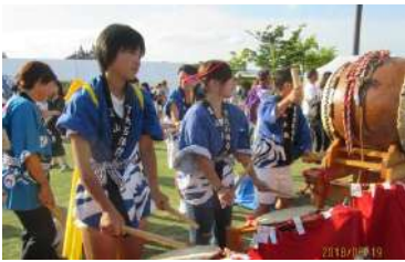
下大石太鼓保存会