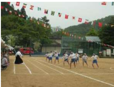
高学年の棒術披露