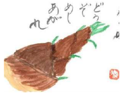
作者 熊沢 八重