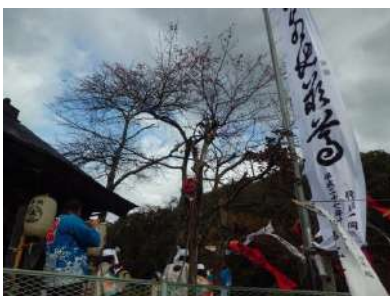
新調された地蔵様の旗