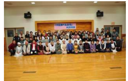
スタッフ全員で記念写真