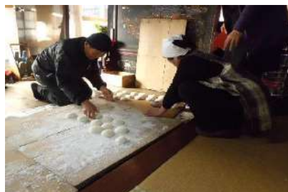
お餅を丸めています

先日大善寺報恩講準備のお手伝いをさせて頂きました。つきたてのお餅を丸めたり、昼食の準備をしたり…一番感動したのは「ひきな炒り」です。お餅にからめて頂いたのですが、お餅と相性抜群!!大石に来るまでひきな炒りを知りませんでした。作り方も、大根は塩もみして水分を出してから炒めると大根が崩れず、さらに炒めても大根から水気が出るので、それも捨てるとう味が染みておいしく作れることを初めて知りました!!確かに私、生の大根のままやったら大根が崩れてしまったんです。新たな料理を学ぶことができうれしいです!教えてくださいありがとうございます!