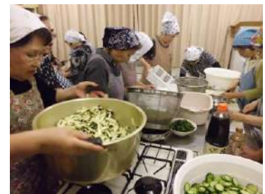
野菜活用講座の一コマ

11月開催予定の大石食べもの博で、皆さんの味や技を見られるのが楽しみです。私もスイーツの新メニュー考え中です!