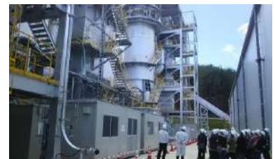
焼却炉見学の様子

11月11日、石田に建設された仮設焼却炉施設を見学してきました。平成30年まで64,000t焼却する予定との説明でした。その後、虹彩館でお湯につかり料理を堪能して親睦を深めました。総勢26名の参加でした。(久子)