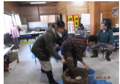
霊山神社での餅つき体験

この号が出る頃は新年を迎えています、編集の今はずいぶん年末。大石の皆さんも新年を迎える準備をされました。東京の実家では門松や注連縄は買うものという認識だったのですが、大石の皆さんは材料をすべて近くから持ち寄り、立派な門松や注連縄を作ってしまうのです。やっぱり大石ってすごいです!6月に大石に来て、たくさんの方々に会い、体験し、充実した日々を送りました。これもひとえに大石の皆さんのおかげです!ありがとうございました!2015年もどうぞよろしくお願いいたします。