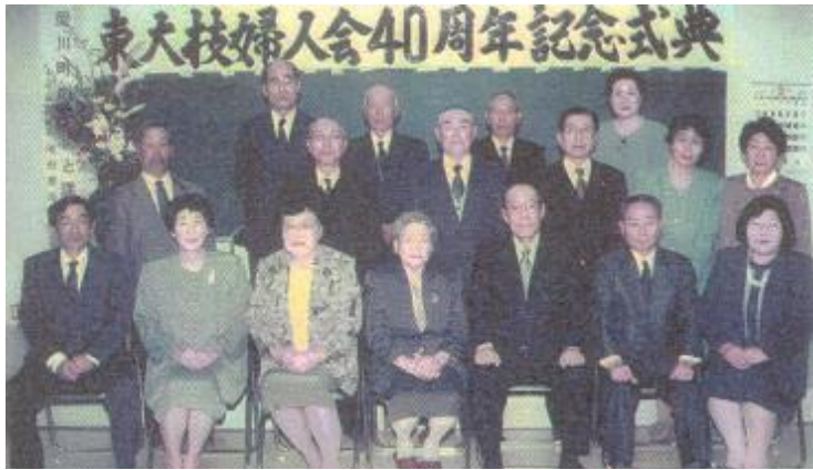
思い出の写真 ～ 平成8年3月