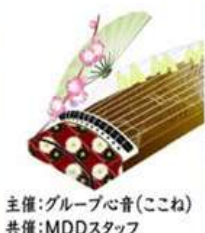
主催:グループ心音(ここね) 共催:MDDスタッフ