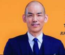
木山裕策 代表曲「home」 NHK 紅白歌合戦出場曲

昭和歌謡コンサートは、長く愛される唱歌や歌謡曲など、誰もが一度はロゾさんだことのある楽曲をプロのボーカリストと共に楽しむイベントです。友と駆けた幼少時代、大切な人と過ごした青春時代。歌と共に、あの頃にタイムスリップしませんか!