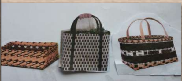
出品予定作品です。ぜひご覧ください