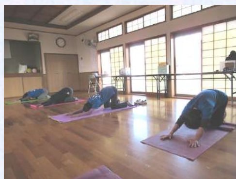
「まいまい体操」中の写真

して歩くようになった、近所の方と話す機会が増えた等の声が聞こえます。何回か欠席する人がいると、どうしたのかな？具合でも悪いのかな？帰りに寄ってみようかな？など参加者同士の交流も増えました。道林地区は農家が多いので農繁期は参加人数が減りますが、1人でも2人の日でも集会所の鍵を開けるようにして継続しています。去年6月から「ふれあいいきいきサロン・遊遊会」も月1回開催することになりました。ご近所同士一層のコミュニケーションを図り、自分のことは自分でできるようにいつでも健康で笑顔でいられるようにと活動しています。