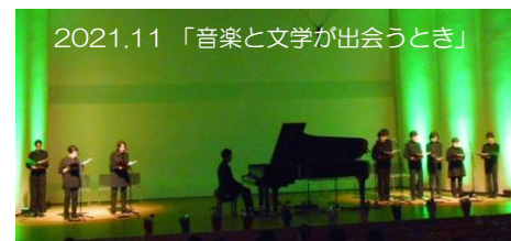
2021.11 「音楽と文学が出会うとき」