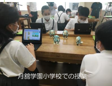
月舘学園小学校での授業

例えば私たちは、排せつ介助にかかる介護者の負担を軽減し、かつ被介護者の尊厳を守ることを目的に介護用品を開発しています。また昨年度からは、市内の全小学校で「あるくメカトロウィーゴ」を使ったプログラミング授業を実施しています。入力したプログラムが、親しみやすいロボットの動作で体現されると、画面上に留まらない学びに子ども達の目が輝きます。これからもロボットを通じてたくさんの笑顔届けたいと思います。（info@livingrobot.co.jp 徳永）