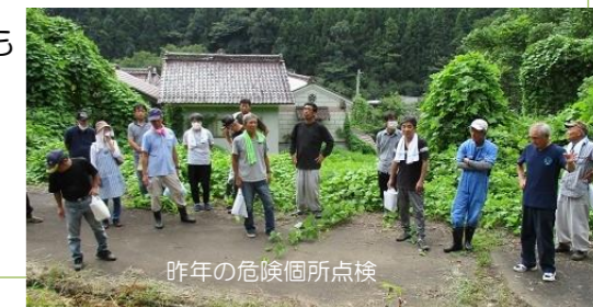
昨年の危険箇所点検

地域の情報を丁寧に拾いあげ、小さな気づき反映させていくことで、いざという時に本当に役立つ防災マップになると思います。私たちは、地区全体のマップ作成から着手して、行政区単位へと落とし込む方法を探りましたが、逆のパターンも考えられます。取りかかりやすい、小さな単位から始めてみて、必要に応じて大きくして行っても良い。まずは、できるところから始めてみてください。（090-5188-4888 橋内）