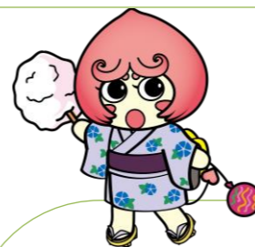
伊達市「だてちゃん」